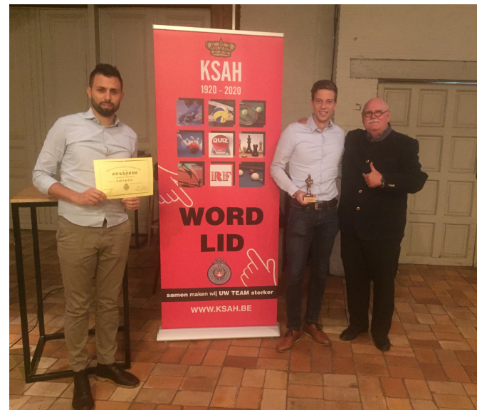
SAMEN maken wij UW TEAM sterker Amista (2019)